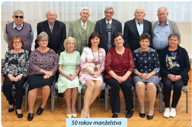
50 rokov manželstva