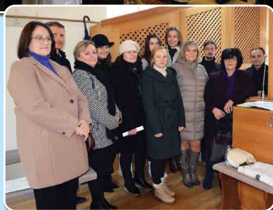
Hodová slávnosť vo farskom kostole Krista Kráľa v Čiernych Klačanoch sa konala 24. novembra 2024