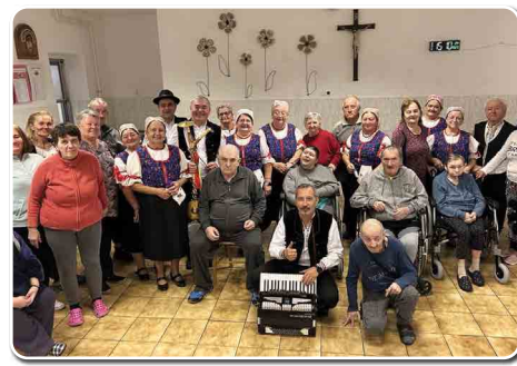
FS Širočina po vystúpení s klientami ZSS Svetlo Olichov.

Folklórny súbor Širočina sa pravidelne zúčastňuje na všetkých kultúrnych a cirkevných akciách v obci. Svojím spevom rozdávali radosť a dobrú náladu v Chyzerovciach na Lupiniarskej paráde, v Prílepoch – Vitajte susedia, v obci Malé Chyndice a zúčastnili sa okresnej súťaže seniorských folklórnych súborov v Lovciach. Dňa 23. októbra dostali pozvanie účinkovať v sociálnom zariadení Svetlo v Olichove, kde svojim spevom spríjemnili a rozveselili občanov v sociálnom zariadení. S pásmom Rok na dedine v decembri vystúpili v Poľnom Kesove a v Slepčanoch.