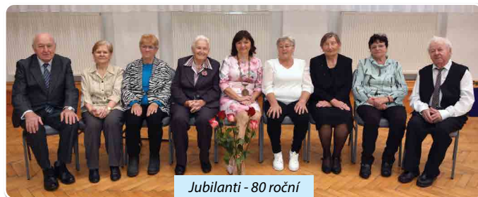
Jubilanti - 80 roční