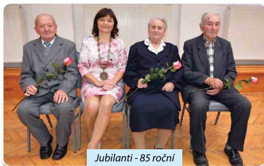
Jubilanti - 85 roční