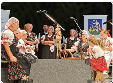
FS Širočina na vystúpení v Zlatých Moravciach.

Folklórny súbor Širočina sa pravidelne zúčastňuje na všetkých kultúrnych a cirkevných akciách v obci. Svojím spevom rozdávali radosť a dobrú náladu v Chyzerovciach na Lupiniarskej paráde, v Prílepoch – Vitajte susedia, v obci Malé Chyndice a zúčastnili sa okresnej súťaže seniorských folklórnych súborov v Lovciach. Dňa 23. októbra dostali pozvanie účinkovať v sociálnom zariadení Svetlo v Olichove, kde svojim spevom spríjemnili a rozveselili občanov v sociálnom zariadení. S pásmom Rok na dedine v decembri vystúpili v Poľnom Kesove a v Slepčanoch.