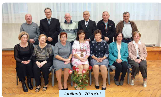
Jubilanti - 70 roční